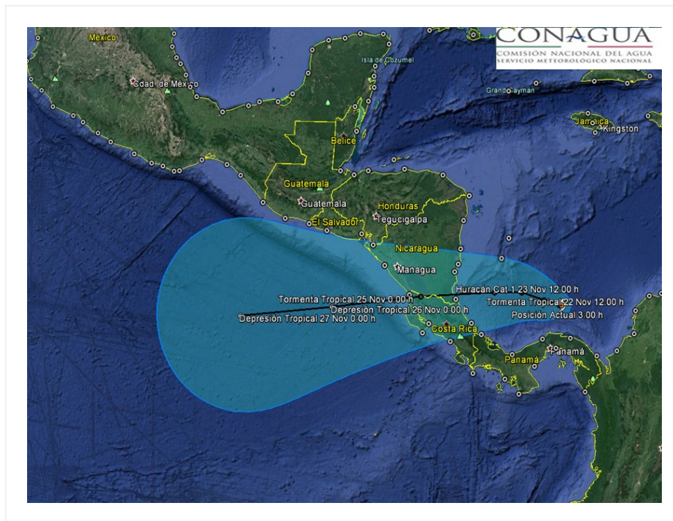
Trayectoria pronóstico de la tormenta tropical "OTTO"